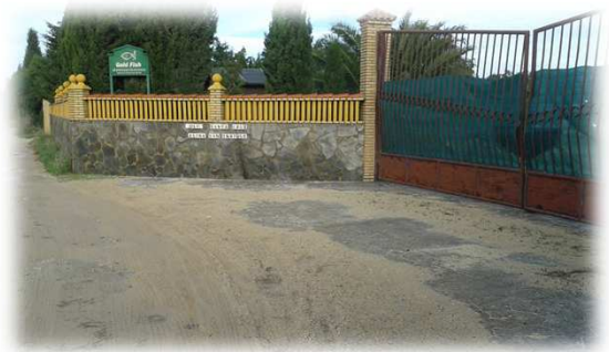
Instalaciones Gold Fish Molino de Santa Cruz

La primera construcción relativa a la marisma que podemos observar en este recorrido, es el molino de marea de Santa Cruz (o Molino Viejo) del siglo XVIII, que se encuentra bastante transformado. Estos molinos eran los encargados de realizar la molienda aprovechando la energía mareomotriz. En Chiclana llegaron a existir 5, pero en la actualidad sólo quedan 2, que han sido transformados para otros usos.