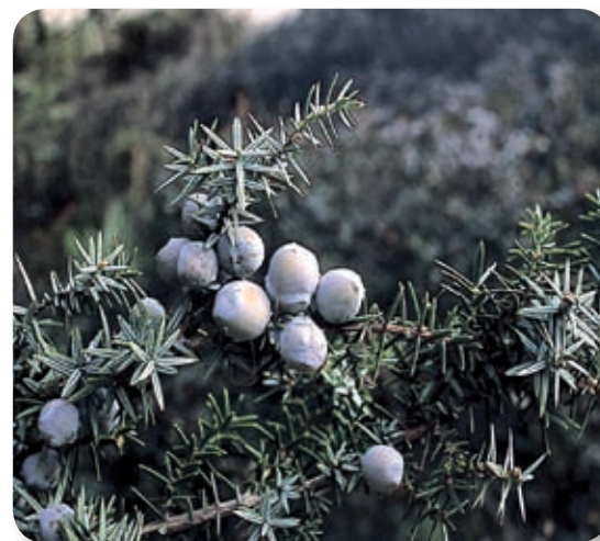
El enebro existente en este parque supone la segunda mayor extensión de ejemplares de la península Ibérica, sólo superada por los de Doñana. Sus raíces, adaptadas a estos suelos arenosos y sueltos, contribuyen a la fijación del terreno. Su madera es especialmente resistente y flexible, lo que hizo que sirviera frecuentemente en la construcción (pilares, vigas, dinteles, etc)