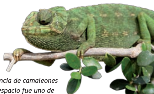
La presencia de camaleones en este espacio fue uno de los motivos de su declaración como parque natural. Catalogada como especie vulnerable, evitaremos el molestarlo innecesariamente.

Casi la totalidad del recorrido discurre por un frondoso pinar de pino piñonero [2], árbol característico de este parque natural, que proporciona sombra a una gran diversidad de plantas que componen el ecosistema, siendo las más representativas de este bosque los palmitos, lentiscos, acebuches, jaras y retamas. Nuestro silencio se verá recompensado por los sonidos que emiten numerosas aves de pequeño porte. Viven aquí también un gran número de animales que pasan más inadvertidos, pero cuyos rastros son fácil-